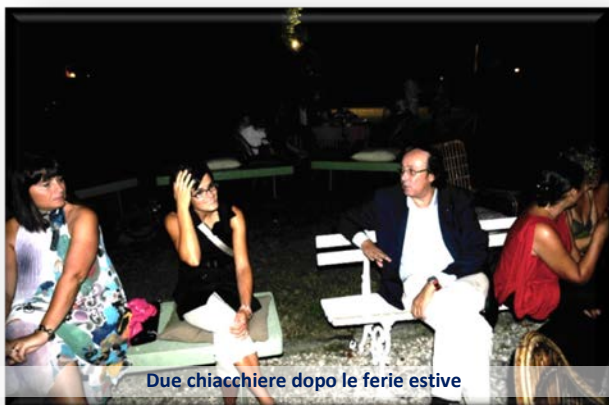
Due chiacchiere dopo le ferie estive