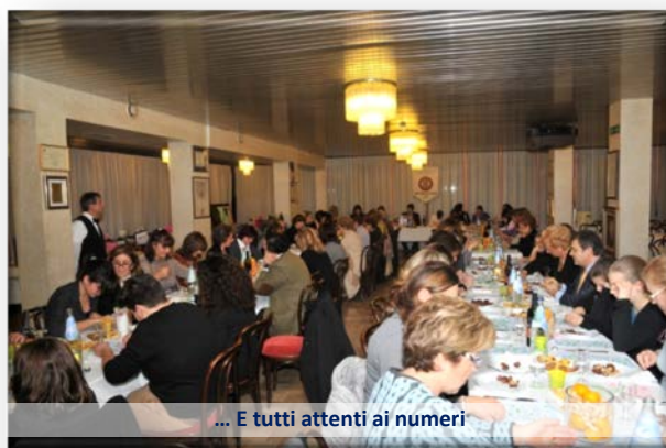
... E tutti attenti ai numeri