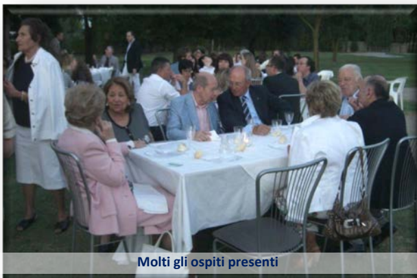
Molti gli ospiti presenti

dalla suggestiva illuminazione del campo di gara, ha gratificato i numerosi presenti.