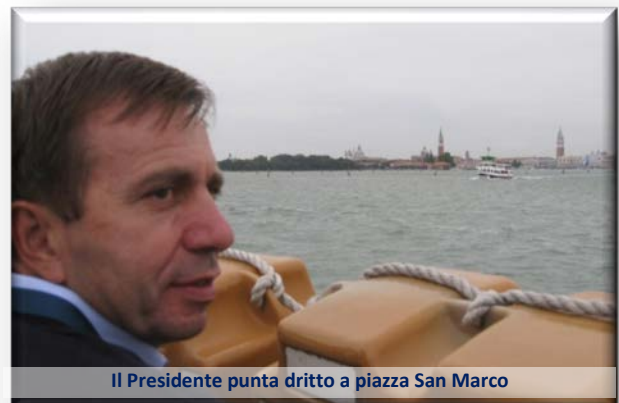
Il Presidente punta dritto a piazza San Marco

La seconda tappa è stata l'isola di Torcello, con l'interessante visita alla cattedrale di stile romanico, dedicata a Santa Maria Assunta. Fondata nel 639 è tra le più antiche costruzioni veneto-bizantine rimaste nella laguna. La visita è quindi proseguita al campanile dell'XI secolo a base quadrata e inconfondibile nel paesaggio lagunare e alla bellissima Chiesa di Santa Fosca, nei pressi della cattedrale, costruita intorno al