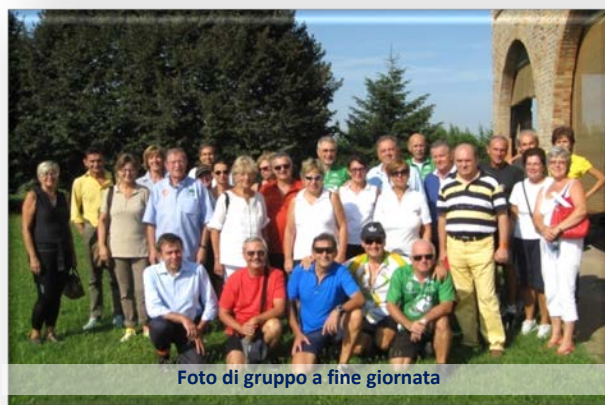
Foto di gruppo a fine giornata

La tappa è stata interrotta verso l'orario del pranzo, non con il classico punto di rifornimento che siamo abituati a vedere lungo le strade del Giro d'Italia (sacchetto al volo senza fermarsi neanche a fare pipì), ma con una fermata ENO-GASTRONOMICA alla famosa Locanda del Bosco, pennichella compresa.