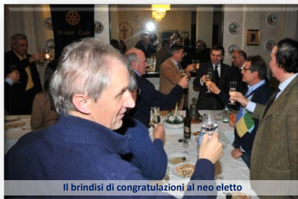
Il brindisi di congratulazioni al neo eletto