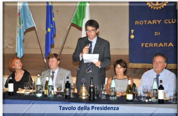
Tavolo della Presidenza

Per restare competitivi anche la Candy ha dovuto affrontare il difficile ed attuale periodo della globalizzazione con acquisizioni di molte aziende all'estero.