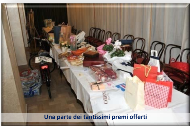
Una parte dei tantissimi premi offerti