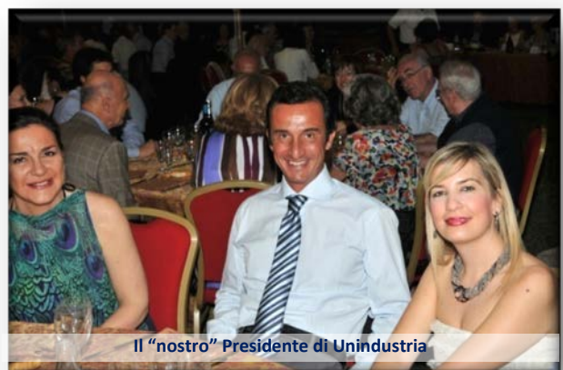
Il "nostro" Presidente di Unindustria

E' diventata tradizione che in occasione della Fiera delle Pere il Rotary di Cento assegni il Premio Renazzo ad un personaggio che si è distinto nel nostro territorio nei settori: industria, artigianato, commercio ecc.