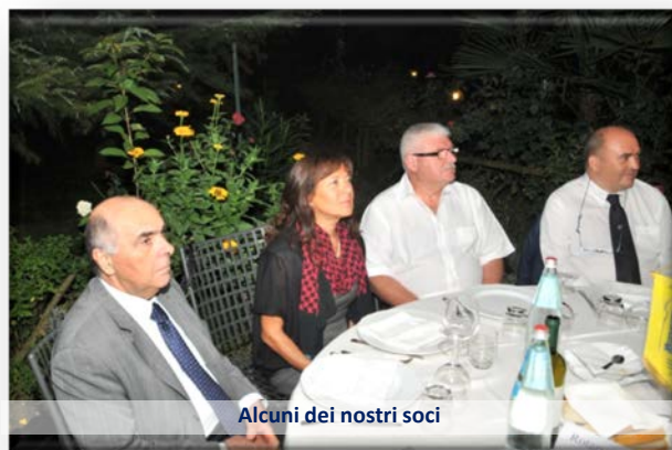
Alcuni dei nostri soci

Non poteva mancare in bel trio che ha ravvivato la serata con ottimi brani musicali. Ai partecipanti è stata offerta una bella incisione numerata, raffigurante l'Abbazia di Pomposa, opera dell'Arch. Flavia Bustacchini.