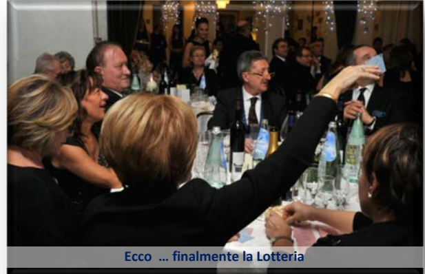
Ecco ... finalmente la Lotteria