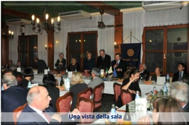
Una vista della sala