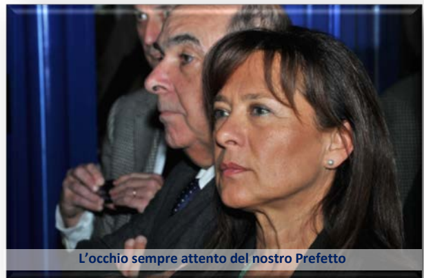
L'occhio sempre attento del nostro Prefetto