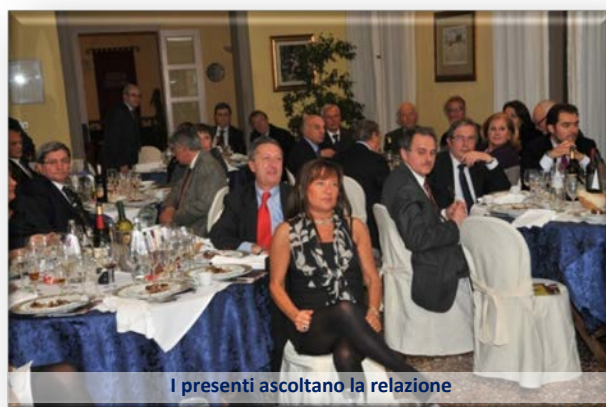
I presenti ascoltano la relazione