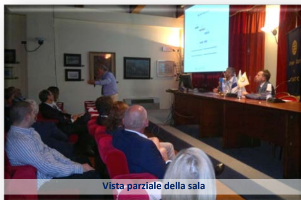
Vista parziale della sala

Molto abbiamo appreso nella "lezione" di questa serata dove i Docenti hanno insistito rimarcando come le modificazioni genetiche dei vegetali siano sin dalle origini della terra un'evoluzione propria della natura sulla quale l'uomo ha sempre posto particolare attenzione selezionando quelle piante frutto di naturali incroci che davano maggior resa e sicurezza per la salute. Oggi la scienza arriva a integrarsi coi processi naturali facilitando l'introduzione nel DNA delle piante quei geni che permettono di ottenere prodotti più resistenti ai fattori climatici e biologici incrementando notevolmente la quantità prodotta e controllando sempre più la qualità per la sicurezza alimentare. E' un'evoluzione inevitabile ed è l'unica risposta ai bisogni alimentari dell'umanità sempre crescente