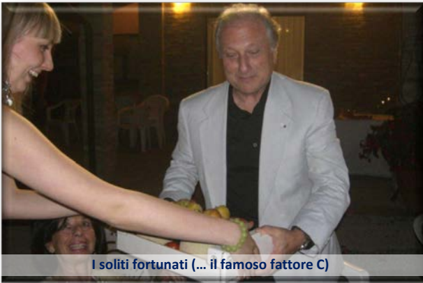
I soliti fortunati (... il famoso fattore C)