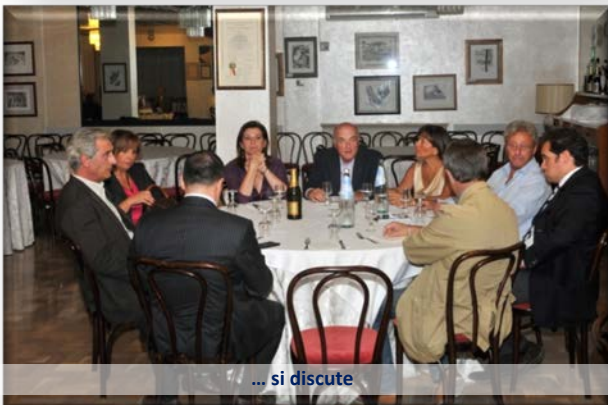
... si discute