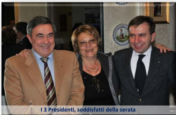
I 3 Presidenti, soddisfatti della serata