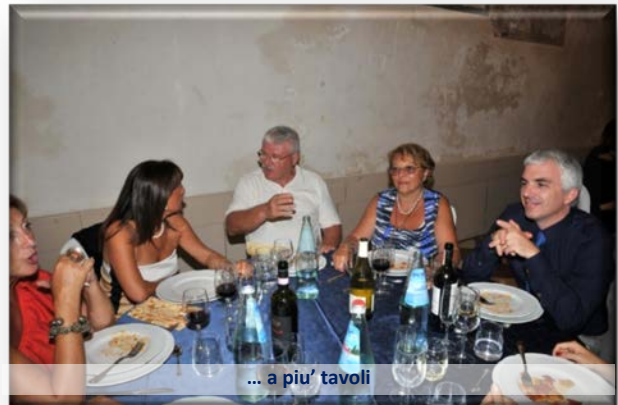
... a piu' tavoli