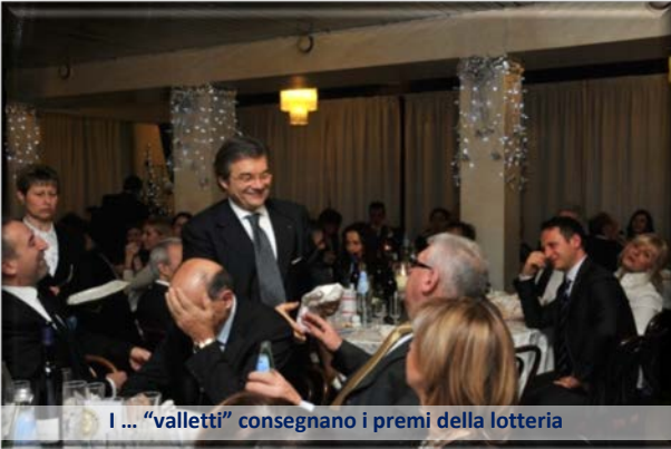
I ... "valletti" consegnano i premi della lotteria