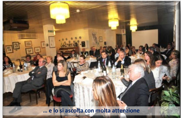
... e lo si ascolta con molta attenzione