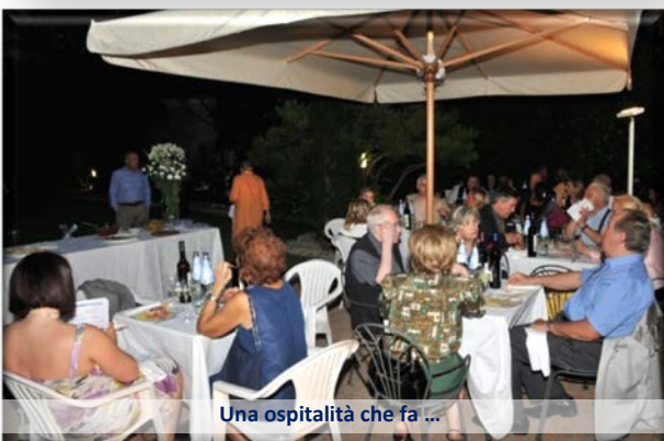
Una ospitalità che fa ...