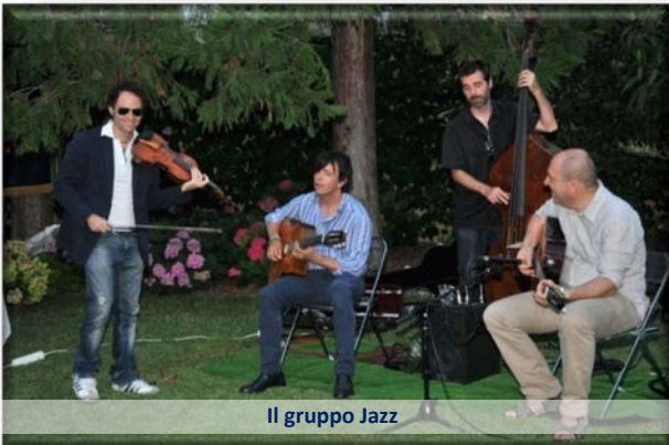
Il gruppo Jazz