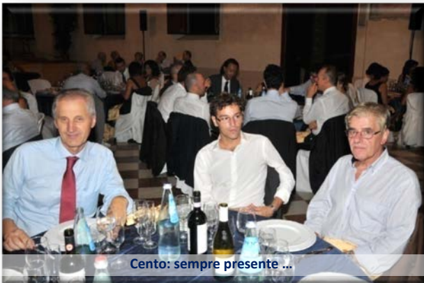
Cento: sempre presente ...

Continuo ed enorme è stato il successo degli elettrodomestici Candy in Italia e nel mondo, un milione prodotti fino al 1967, 50 milioni raggiunti nel 2000 arrivando ai 100 milioni di pezzi nel 2009.