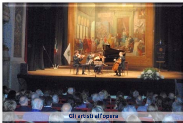
Gli artisti all'opera