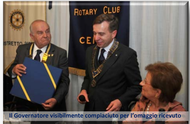
Il Governatore visibilmente compiaciuto per l'omaggio ricevuto