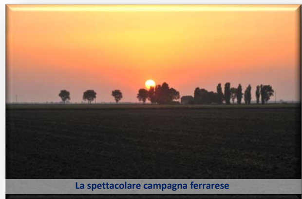
La spettacolare campagna ferrarese

il tutto nell'incantevole cornice di uno spettacolare tramonto dove il sole, nella sterminata pianura, si tuffava in mezzo alle pannocchie di Carnaroli (non si chiamano spighe).