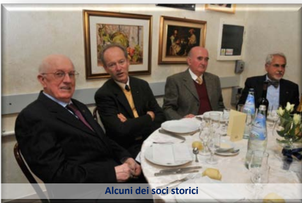
Alcuni dei soci storici