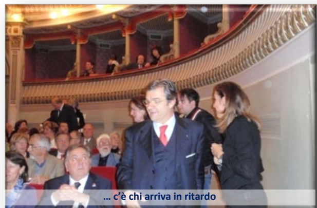
... c'è chi arriva in ritardo