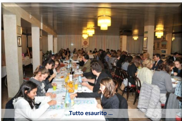
Tutto esaurito ...

Splendida idea e organizzazione perfetta dei nostri giovani del Rotaract di Cento in occasione di questo periodo autunnale: come tutti gli anni tombola + marroni per San Martino.