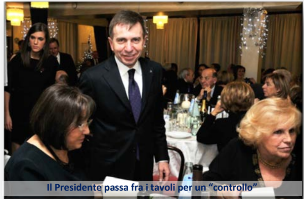
Il Presidente passa fra i tavoli per un "controllo"