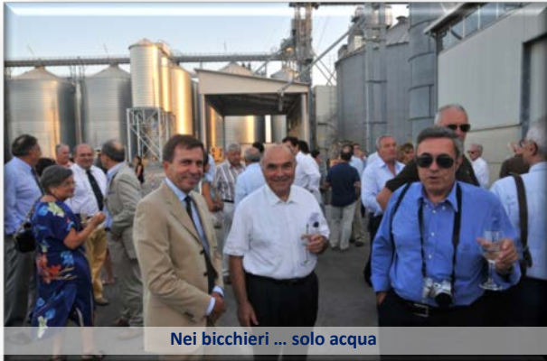
Nei bicchieri ... solo acqua