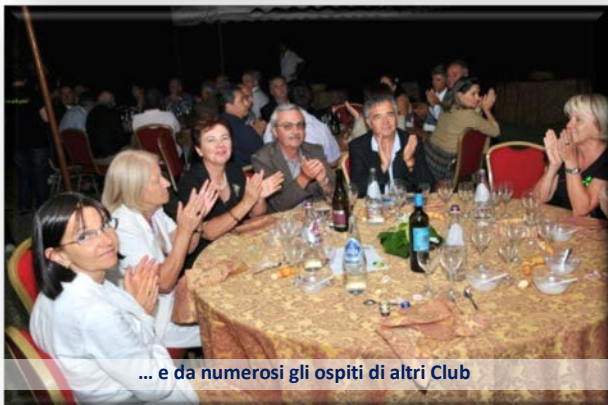
... e da numerosi gli ospiti di altri Club