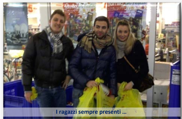
I ragazzi sempre presenti ...

Anche il 2011, come del resto tutti gli ultimi anni, l'ultimo Sabato di Novembre per il nostro Club è un appuntamento molto importante e sentito. L'appuntamento fissato è presso il Supermercato Famila di Cento dove, assieme ad altri volontari, i nostri soci, le consorti ed i ragazzi di Rotaract e