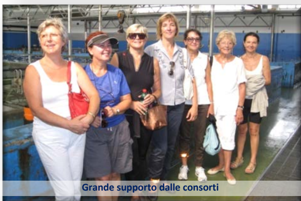
Grande supporto dalle consorti