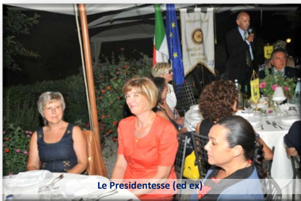
Le Presidentesse (ed ex)