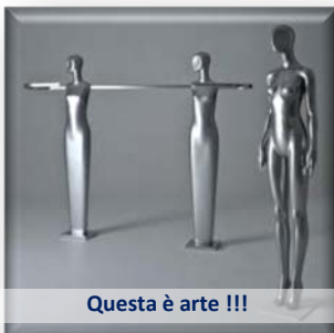
Questa è arte !!!

riconosce la collettività, glielo riconosce questa sera pubblicamente il Rotary Club di Cento, che, nella targa, ha cercato di riassumere i suoi meriti in queste poche e insufficienti parole: