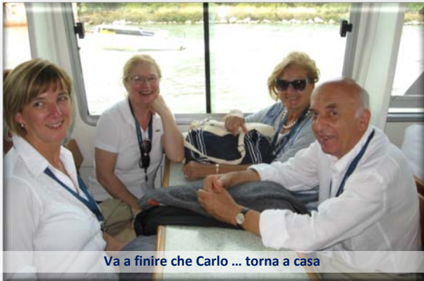
Va a finire che Carlo ... torna a casa