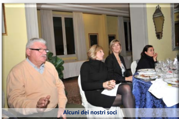
Alcuni dei nostri soci

Oggi le cantine Lungarotti sono un'orgoglio del Made in Italy con vigneti su 260 ettari di terreno di proprietà e 40 in affitto ed una produzione di oltre 3 milioni di bottiglie per anno, l'80% delle quali esportate. Una curiosità: dato l'anomalo caldo di questo estate, per la prima volta la vendemmia è stata effettuata anche di notte, iniziando a metà agosto per il forte anticipo nella maturazione delle uve.