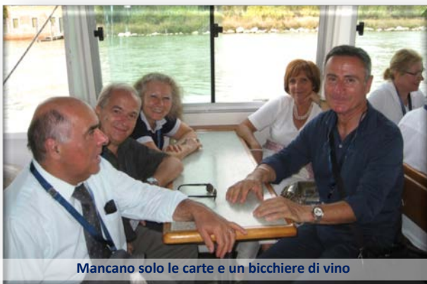
Mancano solo le carte e un bicchiere di vino

l'isola di Pellestrina, abbiamo infatti potuto "vedere da vicino" la struttura della laguna, comprese le tre bocche di porto sulle quali sono attivi i cantieri del Mose. A Mazzorbo, l'isola adiacente a Burano, abbiamo quindi potuto gustare un tradizionale menu' veneziano a base di pesce.