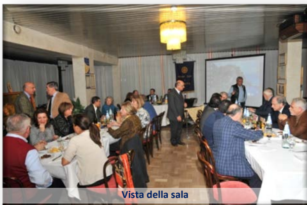
Vista della sala

I risultati ottenuti (7 mesi invece di 24) sono molto soddisfacenti e sono una conferma della validità del programma Visione Futura che dopo la fase sperimentale verrà sicuramente esteso a tutti i distretti del mondo.