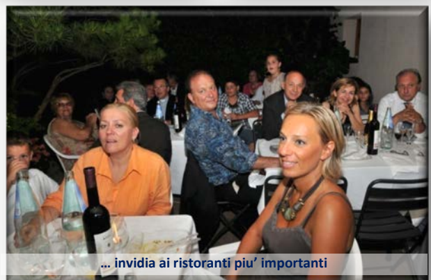
... invidia ai ristoranti piu' importanti