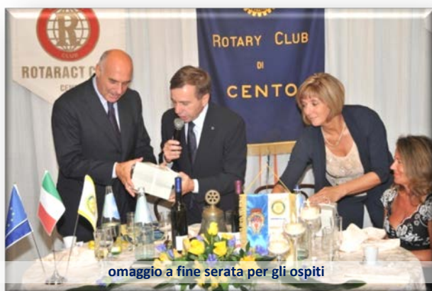
omaggio a fine serata per gli ospiti

Nei loro concisi discorsi questi teenager hanno dimostrato enorme disinvoltura e di avere le idee molto chiare nel portare avanti i progetti del loro Club.