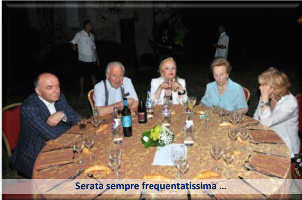
Serata sempre frequentatissima ...

fornisce le sue creazioni a tutti i nomi della alta moda, ai musei, ai set fotografici e a tutte le più prestigiose vetrine da Tokio a Parigi e pure in Cina. Romano orgogliosamente dice di produrre oggi, ogni anno, più di un manichino per ogni Centese e ciò è il frutto di aver saputo fondere la capacità manifatturiera con la passione nella ricerca idealista del senso della forma.