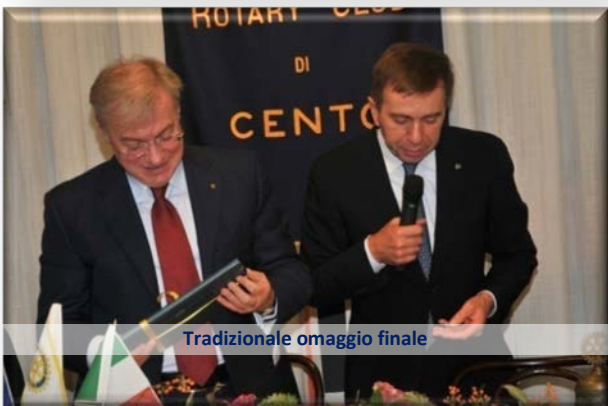
Tradizionale omaggio finale