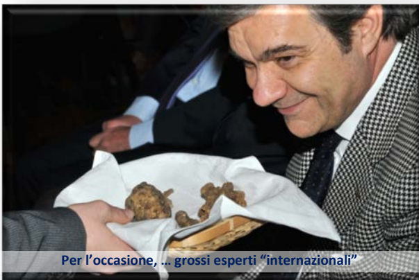
Per l'occasione, ... grossi esperti "internazionali"