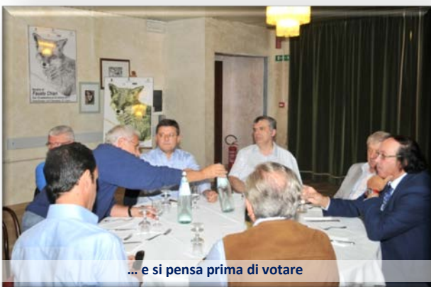
... e si pensa prima di votare

Nella serata già programmata per solo soci, per approvare il bilancio consuntivo annata 2010-11 e preventivo 2011-12, è stato aggiunto all'ordine del giorno anche la votazione dei soci per esprimere il parere sulla proposta trasmessa dal Governatore Pagliarani sul frazionamento del Distretto 2070 in due distretti Emilia Romagna e Toscana.