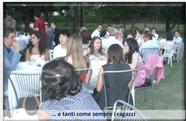
... e tanti come sempre i ragazzi