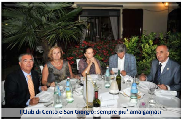
I Club di Cento e San Giorgio: sempre piu' amalgamati

Non poteva mancare in bel trio che ha ravvivato la serata con ottimi brani musicali. Ai partecipanti è stata offerta una bella incisione numerata, raffigurante l'Abbazia di Pomposa, opera dell'Arch. Flavia Bustacchini.