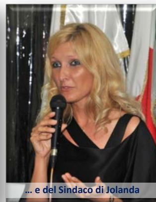
... e del Sindaco di Jolanda

Ghelfi ha sottolineato l'importanza del marchio IGP per il Riso del Delta del Po, un riso davvero molto buono e con grandi potenzialità di mercato nazionale e internazionale. Ha pure rimarcato come la classe dirigente del territorio è e sia stata lungimirante ad investire sulla terra e sui suoi prodotti dedicandovi tanta passione e tanto attaccamento: le armi sempre vincenti per un futuro proficuo.