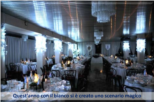
Quest'anno con il bianco si è creato uno scenario magico