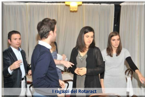
I ragazzi del Rotaract

Splendida idea e organizzazione perfetta dei nostri giovani del Rotaract di Cento in occasione di questo periodo autunnale: come tutti gli anni tombola + marroni per San Martino.