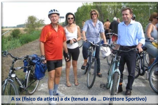
A sx (fisico da atleta) a dx (tenuta da ... Direttore Sportivo)