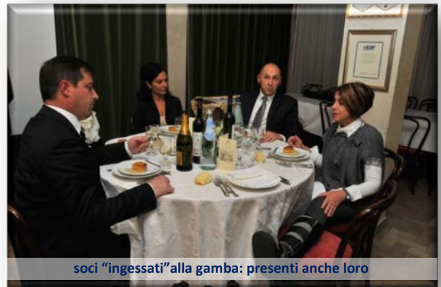
soci "ingessati" alla gamba: presenti anche loro