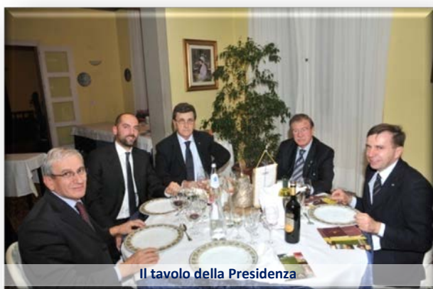
Il tavolo della Presidenza