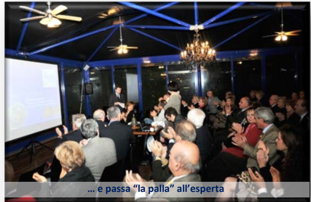
... e passa "la palla" all'esperta