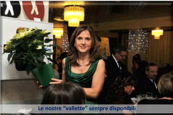
Le nostre "vallette" sempre disponibili