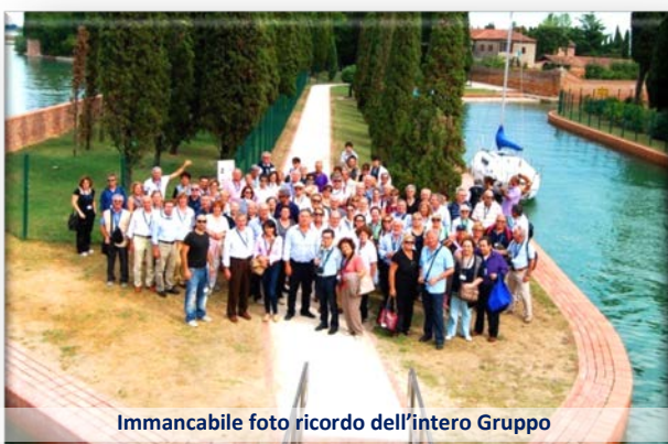
Immane foto ricordo dell'intero Gruppo

La gita ha quindi avuto un inatteso cambio di programma. Sulla via del ritorno non si è infatti fatto tappa a Pellestrina per gustare il famoso gelato della "Sandrina", ma, per motivi tecnici,