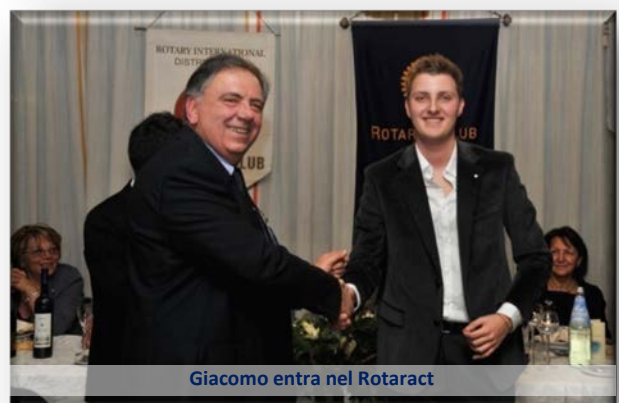
Giacomo entra nel Rotaract

Anche la Guardia di Finanza di Cento era presente col suo Comandante, mentre il Sindaco e il Comandante dei Carabinieri di Cento hanno fatto giungere un messaggio di partecipazione in quanto impossibilitati a partecipare per motivi di servizio.