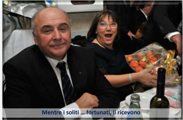
Mentre i soliti ... fortunati, li ricevono