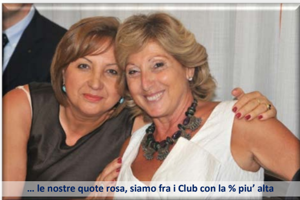
... le nostre quote rosa, siamo fra i Club con la % piu' alta