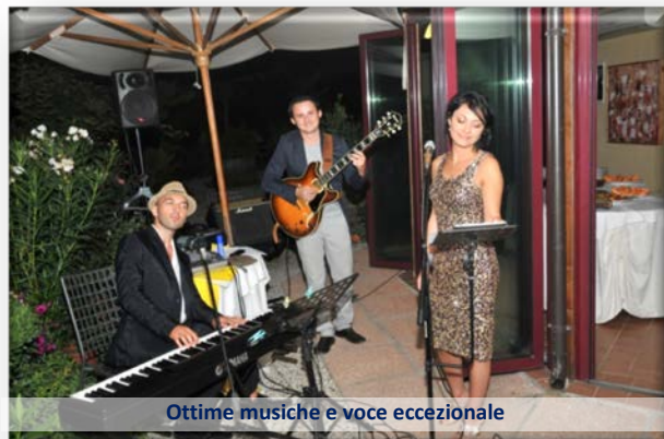
Ottime musiche e voce eccezionale