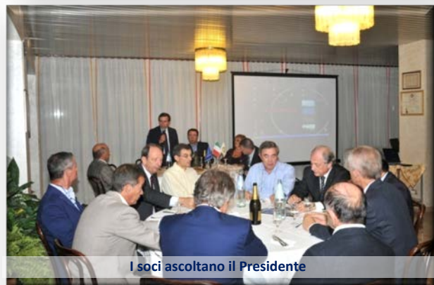
I soci ascoltano il Presidente