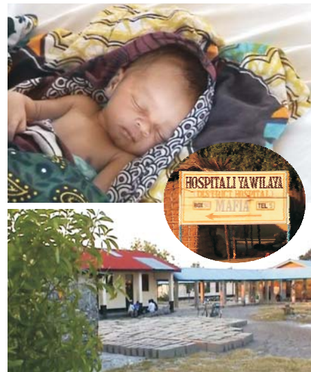
Ospedale di Mafia - Tanzania (Africa)