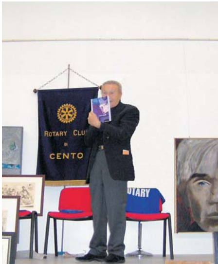
Asta pro-Anffas al Museo Bargellini