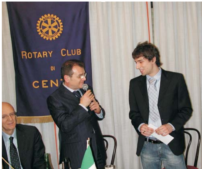
Consegna Premio Zarrì (Borsa di Studio)