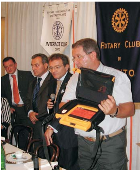
Rotaract: consegna defibrillatore ai VVFF