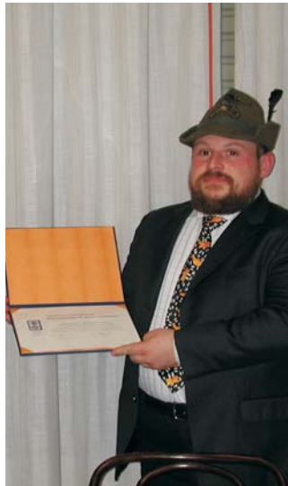
P.H.F. a Protezione Civile (Alpini)