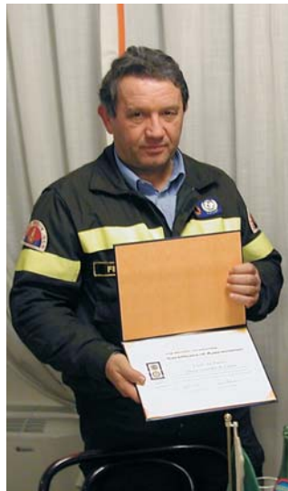
P.H.F. ai Vigili del Fuoco