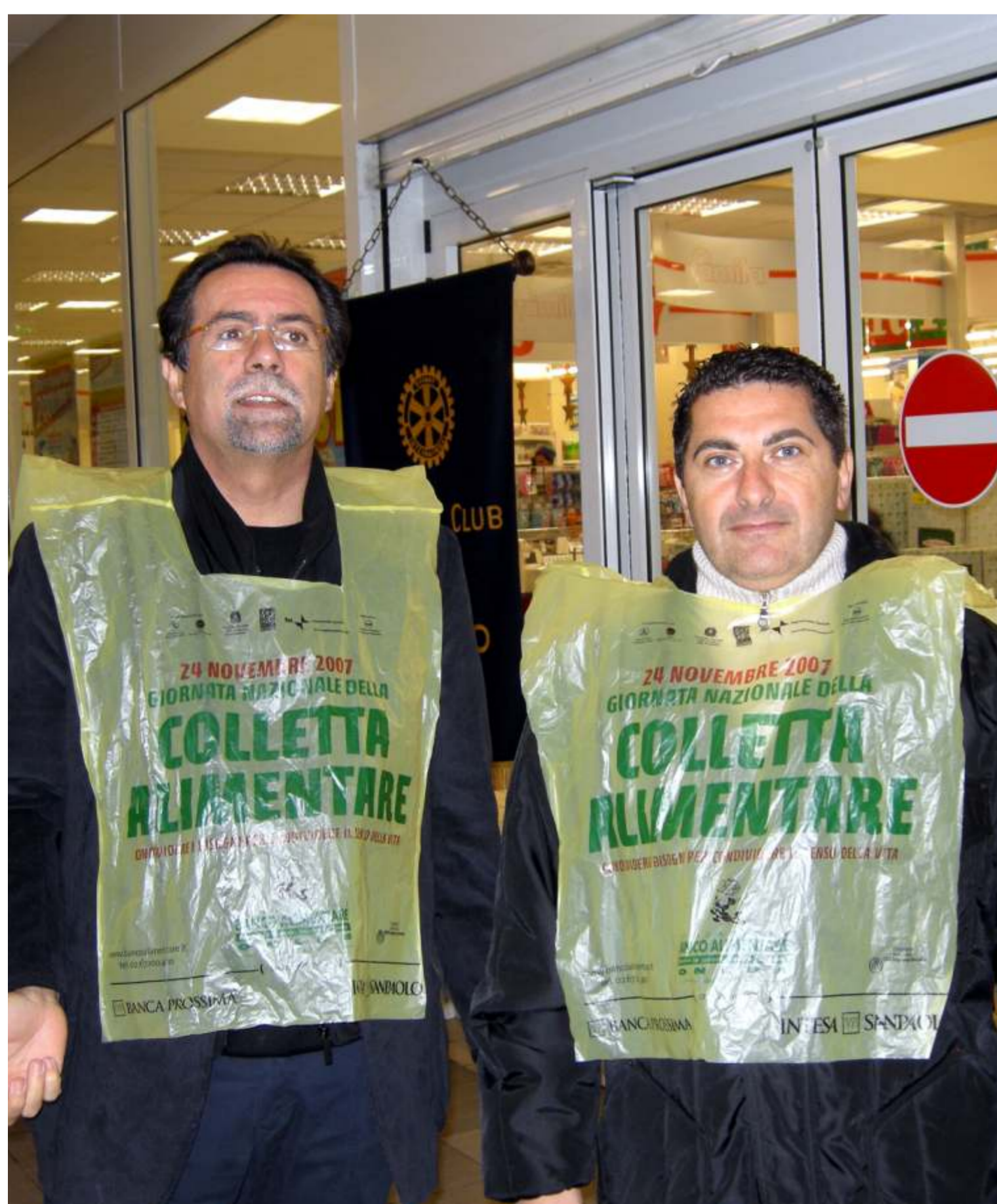
Partecipazione attiva alla "COLLETTA ALIMENTARE"