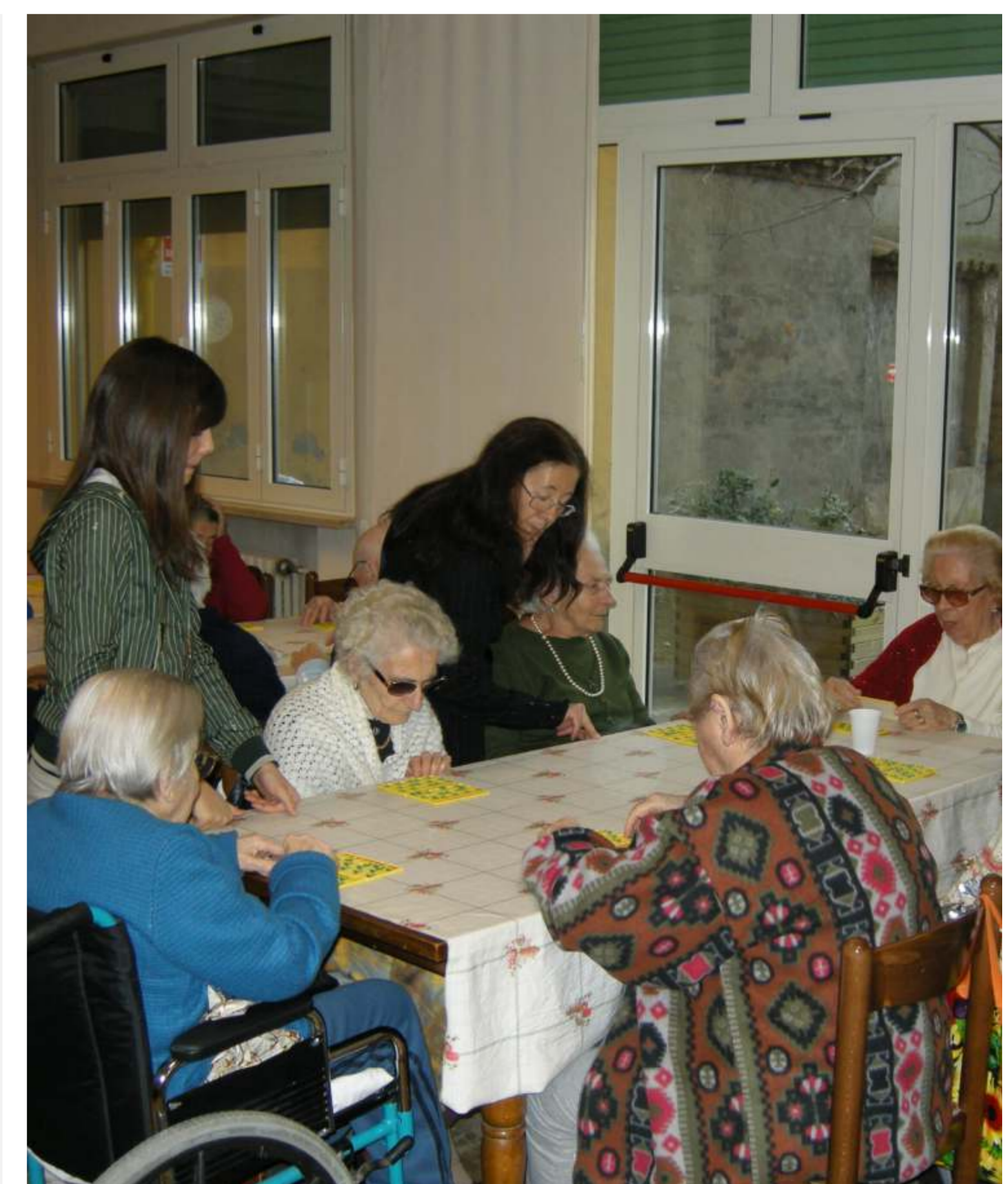
Visita del Club agli anziani con Rotaract-Interact