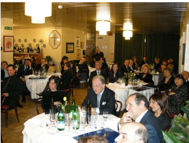
Numerosa l'affluenza dei soci alla serata

Unico appunto è stato fatto sulla Assiduità che, pur dimostrando un importante miglioramento negli ultimi anni, nel nostro club è ancora inferiore alla media del nostro distretto e a tal proposito ha suggerito alcune azioni da intraprendere verso gli assenteisti ingiustificati per tentarne un proficuo recupero.