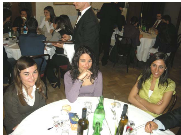
Molto numerosi i Ragazzi anche in questa occasione

Infine ricordiamo che il premio Borsa di Studio Franco Zarri, per ragione di disguidi postali, è stato rinviato e sarà inserito nella serata conviviale del giovedì 22 maggio.