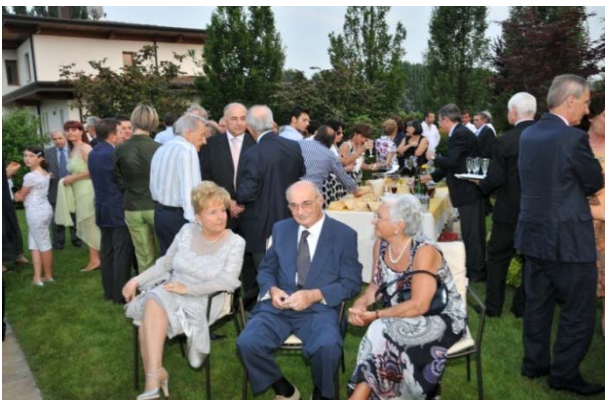
I genitori dei Presidenti che si stanno avvicinando