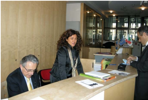
Collaborazione in segreteria fra Distretto e Club di Cento

rito e particolarmente per promuovere il libro L'altra parte di noi.