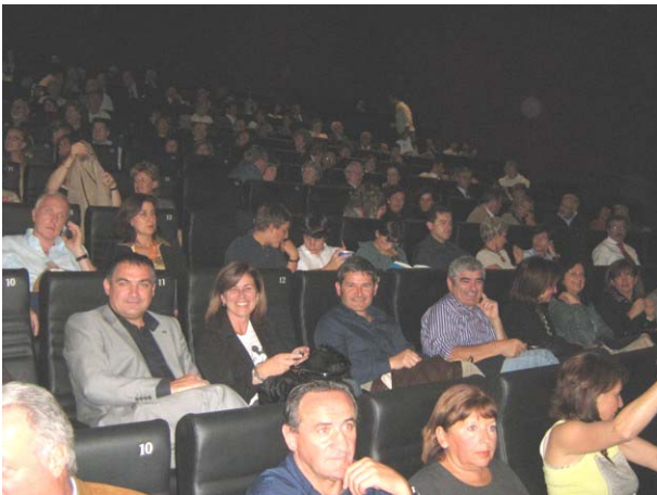
Come sempre il nostro Club era presente con numerosi soci

I 10 Distretti Italiani del Rotary International hanno organizzato questa serata con la sponsorizzazione della Medusa Film che ha messo a disposizione la pellicola del film "Michael Clayton" con George Clooney, per raccogliere fondi, per completare la Campagna Internazionale Polio Plus