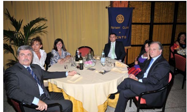
Il tavolo della Presidenza

l'utilizzo della sala del ristorante I Gabbiani dell'Hotel Bologna.