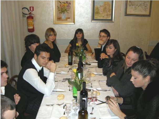
Nelle occasioni importanti i ragazzi sono sempre presenti

commissioni, con i presidenti del Rotaract ed Interact e con i nuovi soci, nel quale si è fatto il punto della situazione dei lavori programmati allo inizio di questa annata, e dove il governatore ha illustrato le linee guida e gli impegni del nostro distretto.