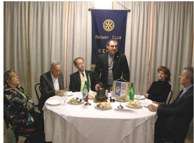
Tavolo della Presidenza