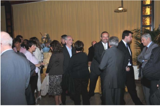
Clima particolarmente "festaiolo"