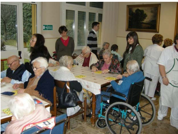
I ragazzi gestiscono la tombola

La riunione, non abituale sia nei tempi che nel luogo, ha contribuito a far passare alcune ore liete alle 32 ospiti ultraottantenni del Pensionato Cavalieri di Cento, in una giornata di festa che è diventata appuntamento abituale per il nostro Club.