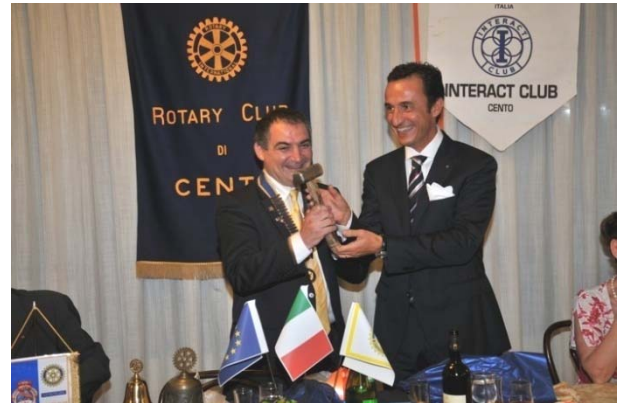
In questo fine anno anche ... regali utili

che ha gratificato tutti i soci e tenuto alto il prestigio del Nostro Club.