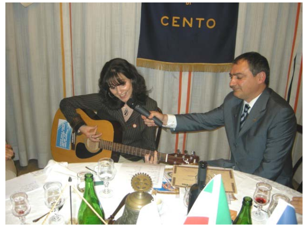
Conclusione inusuale ma molto apprezzata della serata

Naturalmente fra i giovani, che sono tutti più o meno ventenni, si creano delle grandi amicizie che continuano anche negli anni a venire.