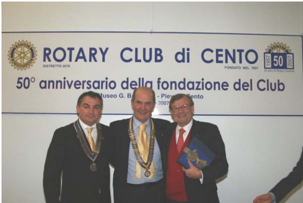
Un presidente con due Governatori

Solo chi possiede una alta statura morale può essere degno di chiamarsi uomo. Prima dei saluti formali conclusivi, ci ha lanciato un messaggio "forte" per farci seriamente riflettere: "Se voi siete tutto questo io sono felice di essere stasera qui con voi."