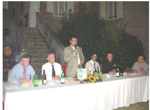
Il tavolo della Presidenza

La manifestazione è iniziata nella Piazza Ferruccio Lamborghini, con i discorsi ufficiali, incentrati in particolare sull'ipotesi di gemellaggio con il Comune di Traversatolo (Parma) e l'accoppiata pere e parmigiano reggiano, per proseguire con il taglio del nastro della 31° Fiera delle Pere da parte del Sindaco di Cento.