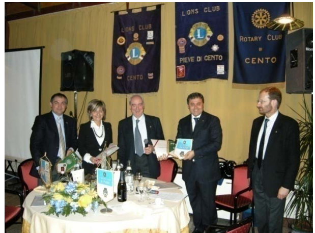
Scambio di gagliardetti a fine serata

Sono anche in costante aumento le elargizioni per interventi nel campo culturale, religioso, dell'arte, dello sport, della protezione civile e per gli aiuti agli enti assistenziali dall'infanzia agli anziani e ai diversamente abili. Questi sono alcuni dei principali motivi per cui