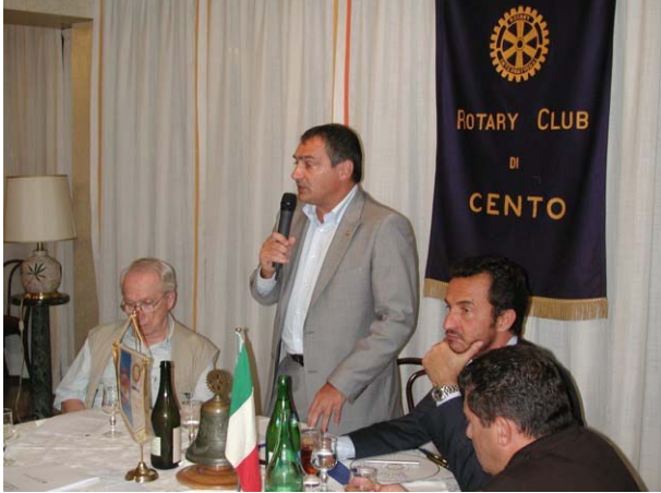
Ritorno dalle ferie: subito una serata impegnativa

discussione dei vari articoli ed ha suggerito alcune modifiche e precisazioni per rendere "le regole del Club" il più limpide possibile. Verso mezzanotte ne sono uscite le bozze aggiornate.