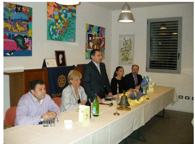
Il nostro Presidente con i responsabili della "Coccinella Gialla"

Il Club, unitamente ai ragazzi del Rotaract, si è recato in visita al Centro Socioriabilitativo "La coccinella gialla" dell'ANFASS Onlus di Cento.