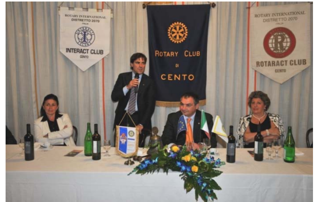
Il Tavolo della Presidenza