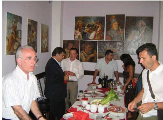
Un boccone assieme ... prima di riprendere il lavoro

L'effetto è stato immediato ed il giorno successivo alla pubblicazione un Rotariano di Cittadella, che ha in corso un Matching Grant con il Kenia, ci ha ordinato alcune copie del libro.