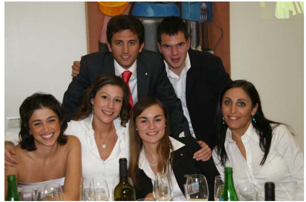
Alcuni dei ragazzi che si sono tanto impegnati