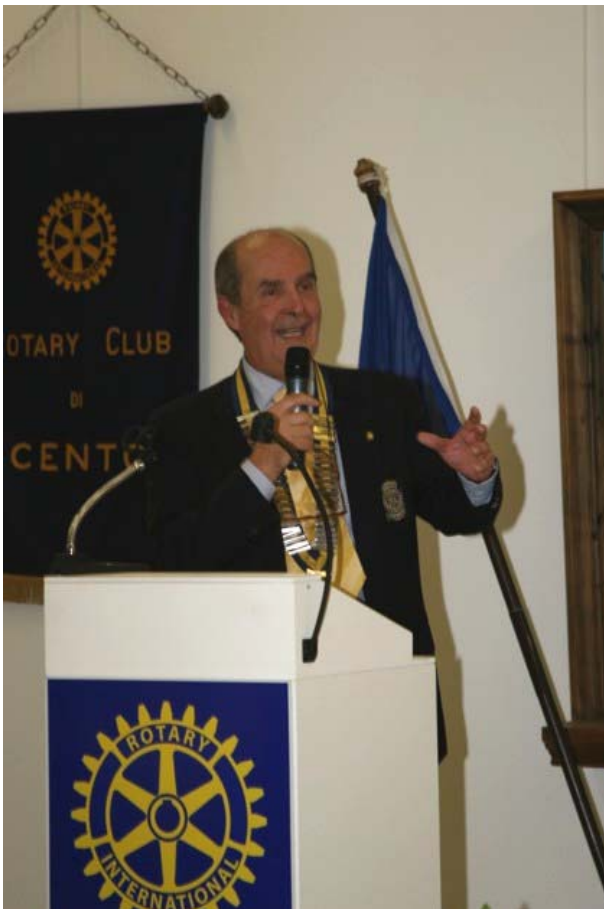
Il Governatore Bassi

Si è iniziato con l'aperitivo nella sala 1 al piano terra, dove una trentina di pannelli fotografici alti oltre un metro, hanno fatto vedere e rivivere la vita di 50 anni del Club dal 1957 ai giorni nostri.