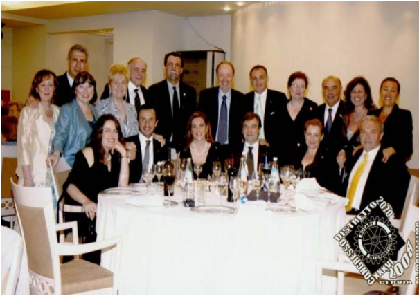
Il bel Gruppo di Cento presente alla cena del Governatore