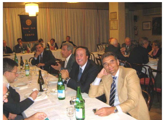
Clima molto sereno ... e già abbastanza estivo

Dopo aver ricordato i più importanti eventi distrettuali (tra cui il Forum Rotary-Rotaract presso il Museo Bargellini il 13 marzo p.v.) sono stati illustrate le iniziative per il 50° anniversario della fondazione del Club, che culmineranno nella serata di mercoledì 17 ottobre, alla presenza del Governatore.