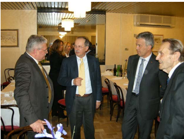
Alcuni soci ed ospiti