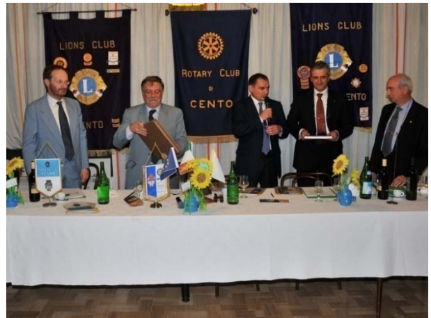
I Presidenti dei tre Club con i relatori

I relatori hanno ben illustrato le principali 3 fasi della malattia che è considerata fra i vari tipi di demenza senile.