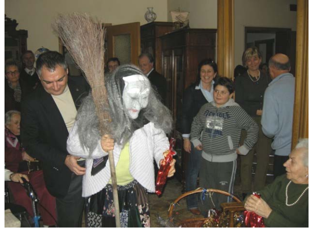
Alla fine è arrivata anche la befana come un "fiocco" di neve