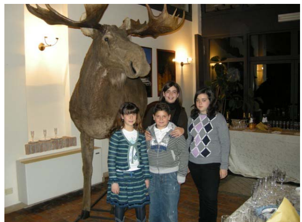
Presenti anche alcuni ragazzi

Dopo 50 mila anni si tira su sabbia per l'industria delle costruzioni e si fa la grande scoperta: oltre la sabbia vengono alla luce i resti di tanti animali anche di razze ora estinte come il Mammut.