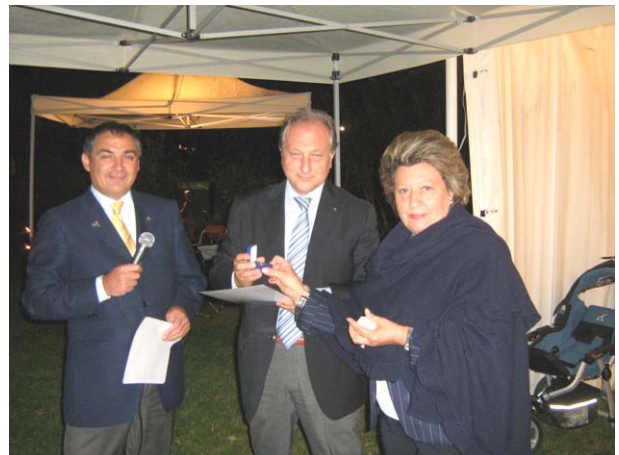
Anche un Grande Manager ... si può commuovere