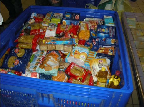
I contenitori dove venivano stoccate le offerte

Nel territorio centese sono stati raccolti complessivamente 13.581 chilogrammi di prodotti alimentari in 16 punti vendita, coinvolgendo circa 190 volontari di oltre 19 associazioni di volontariato.