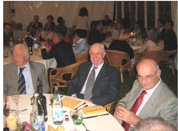
E' un piacere vedere questi ragazzi in pista