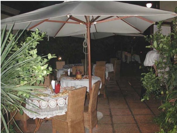
Purtroppo la pioggia l'ha fatta da padrona

Ostellato dove, nonostante l'aperitivo "bagnato dalla pioggia", l'atmosfera accattivante ha coinvolto tutti i Rotariani presenti.