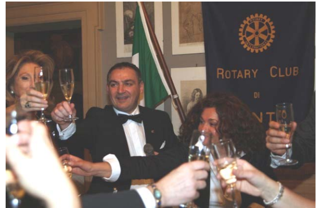
Brindisi di rito

Il Rotaract ha presentato 2 nuovi soci e l'Interact 3 nuovi soci.