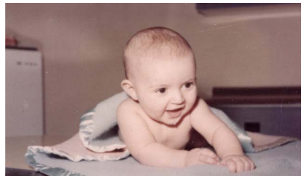
Il nostro Presidente (... qualche anno fa)