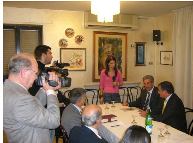
La serata è stata anticipata da una conferenza stampa

Presenti TV locali e stampa qualificata.