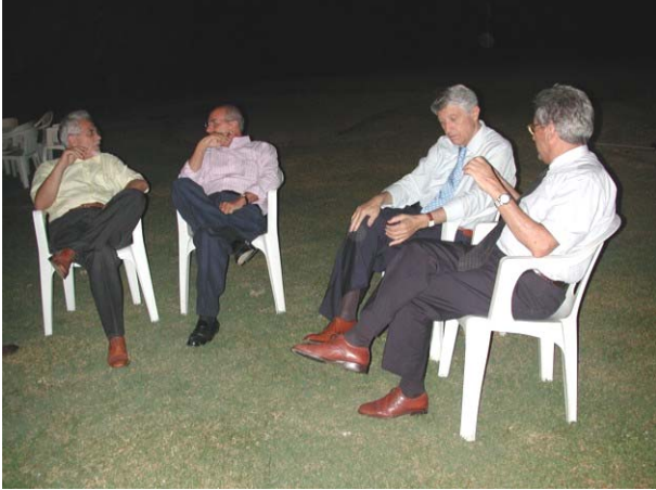
Un po' di relax a fine serata

possibile raggiungere l'obiettivo prefissato che però resta a portata di mano in quanto solo in 4 paesi al mondo (Nigeria, India, Pakistan ed Afghanistan) ci sono ancora focolai della malattia.