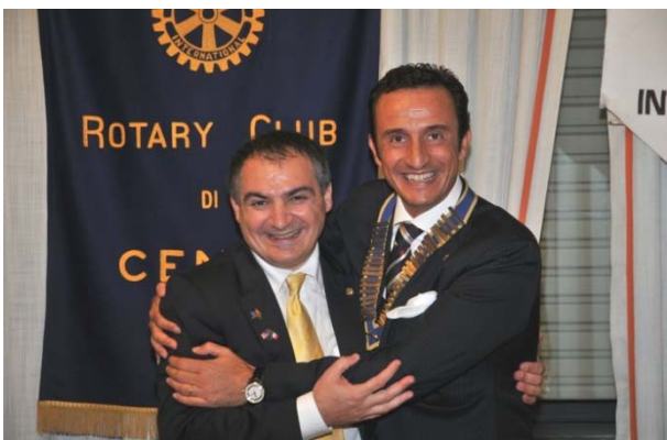
Un abbraccio che la dice lunga sulla "continuità"