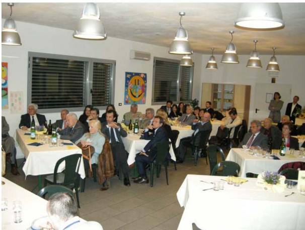
I numerosi soci hanno passato una bella serata