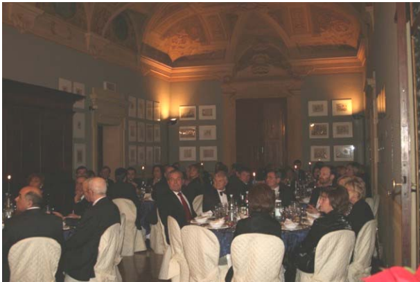
La sala del Castello della Giovannina

Questa festa, come ha detto il nostro presidente, conclude anche i festeggiamenti del cinquantenario del Rotary club di Cento nato il 17 ottobre 1957.