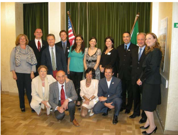
Gli "Americani" con i soci che li hanno Ospitati

Il GSE è un interscambio per circa i mese, di giovani professionisti (max quarant'anni) fra diversi distretti. Esperienza definita da tutti gli interessati Fantastica ed Irripetibile.