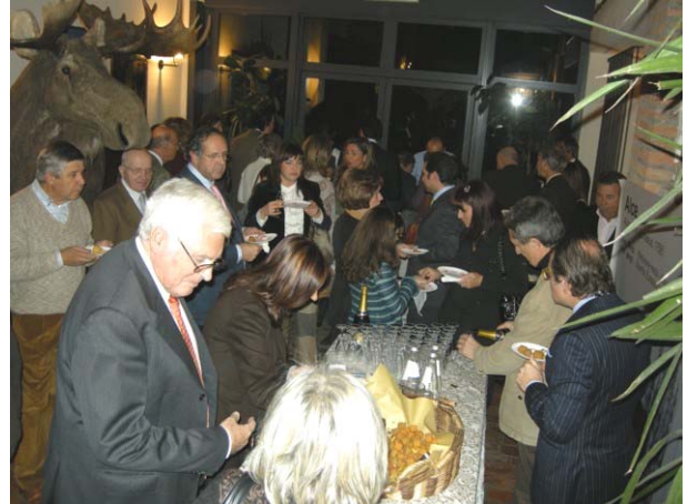
Gli ospiti durante l'aperitivo

Po sfociava più o meno dove sfocia ora il Tronto, succedeva che nella zona di Settepolesini di Bondeno, il Po depositava sabbia e carcasse di animali travolti dalle grandi piene.