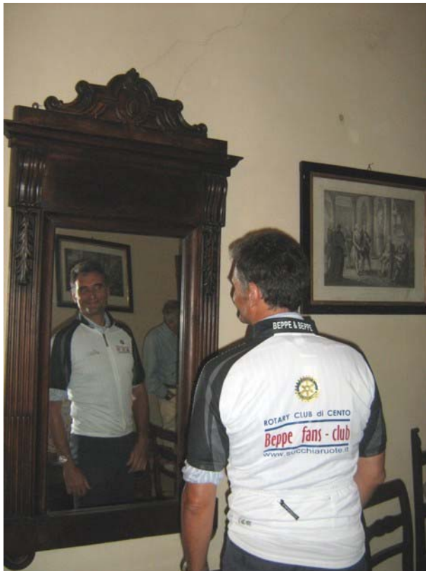
Un grande ciclista

Ottima la cena/merenda abbondante di gnocchini, salumi, formaggi, ecc. e "bombette a mano" ripiene di nero e bollente cioccolato. Fra lunghi applausi, a nome dei tantissimi