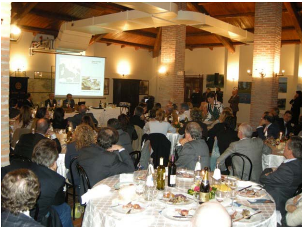
Sala gremita oltre le aspettative