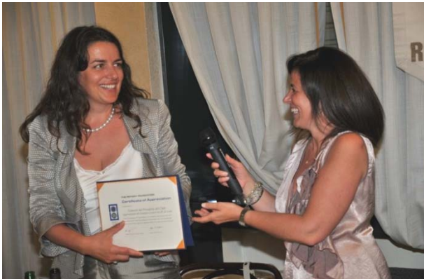
Classico "passaggio" fra le consorti dei Presidenti

impegno dedicato al club in questo anno speciale.