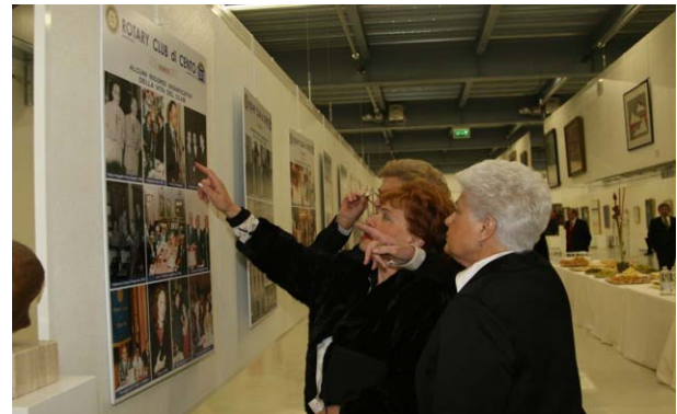
Si comincia ... dalla Galleria Fotografica

Club di Cento. Sono stati tantissimi gli ospiti che hanno accolto l'invito del nostro Club esteso agli ex soci, alle vedove dei rotariani, a tutte le autorità civili, religiose e militari del territorio del Rotary Club di Cento, ai Presidenti dei Club Estensi, ai presidenti di commissione distrettuali ed in primis al Governatore del nostro Distretto 2070 Giancarlo Bassi.