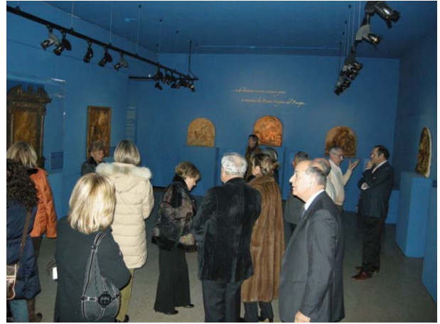
primo dei tre gruppi dei nostri soci in visita

veramente interessante ed ha reso omaggio ad una immagine Mariana (un Presepe in