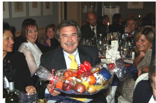
C'è chi è ... più fortunato di altri

Monsignor Salvatore Baviera di San Biagio,