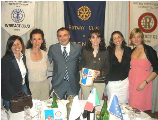
Bellissimo gruppo di "giovani"

Una serata con buona presenza e vivace come si conviene quando i giovanissimi sono i protagonisti.