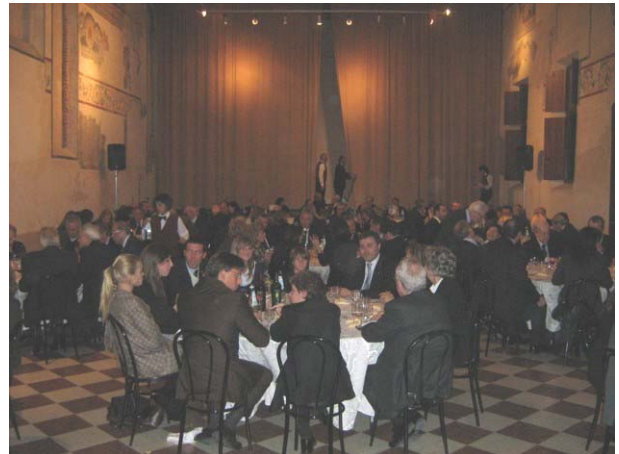
Il salone con tutti gli ospiti

dei rotariani che hanno letteralmente gremito l'ampio salone.