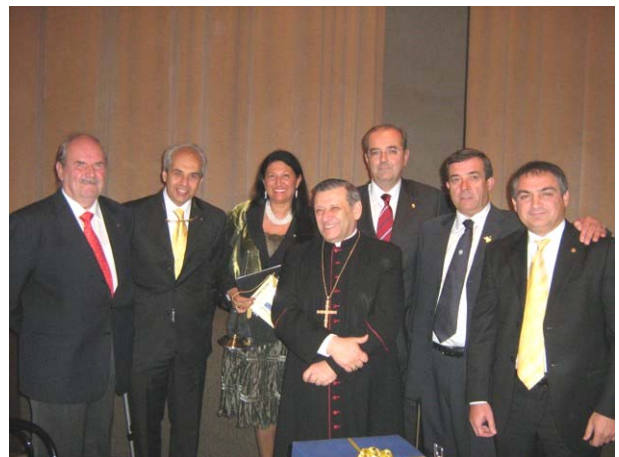
L'Arcivescovo Paolo Rabitti con i Presidenti del Gruppo Estense

La panoramica che Sua Eminenza ha tracciato ha voluto evidenziare i gravi problemi che affliggono l'umanità del nostro tempo. Il degrado nell'educazione delle giovani generazioni è la conseguenza che si manifesta con la crisi delle principali istituzioni come la famiglia, la scuola e la chiesa; è crisi di vita. Nel mondo del consumismo sono scomparsi i valori della morale, della solidarietà e del rispetto delle regole e dell'accettazione dei sacrifici.