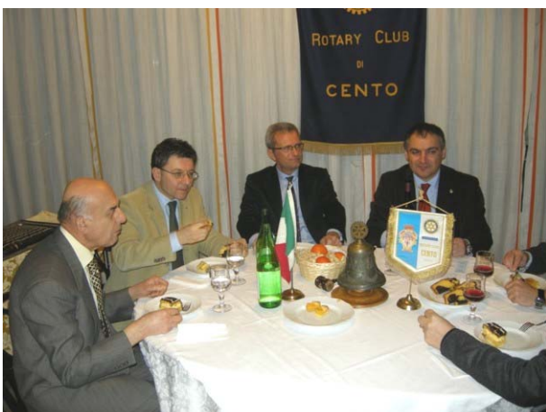
Tavolo della Presidenza

Di questo progetto sono stati già realizzati diversi spezzoni in tutti i comuni ma il comune più virtuoso per lavori già realizzati, risulta essere quello di S. Agostino essendo questo comune situato in un nodo strategico del percorso.