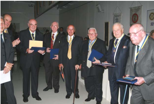
Foto di gruppo di alcuni Senior premiati