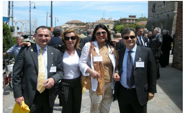
Il Sabato mattina prima dei lavori