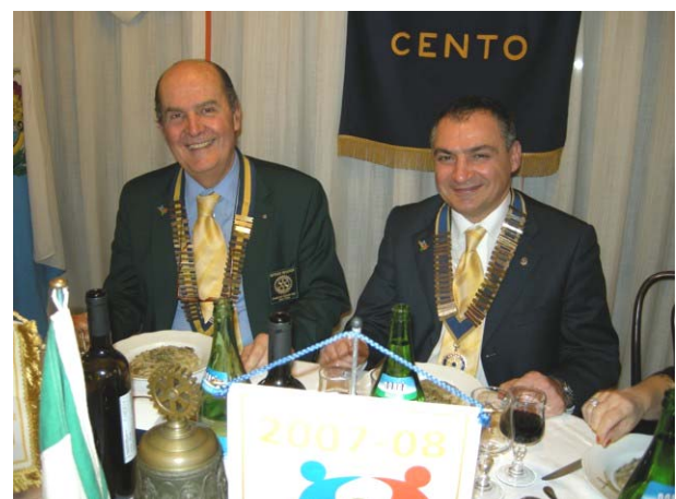
Tavolo della Presidenza