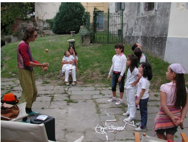
Un animatore ha intrattenuto i nostri bambini

Già SCARICA L'ASINO, questo è scritto sotto MONGHIDORO nel cartello indicativo del paese a ricordare, a chi non se ne fosse accorto, che si trova in cima alle montagne: 840m. di altezza, 45 km da Bologna e 65 km da Firenze.